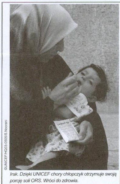
Irak. Dzięki UNICEF chory chłopczyk otrzymuje swoją porcję soli ORS. Wróci do zdrowia.