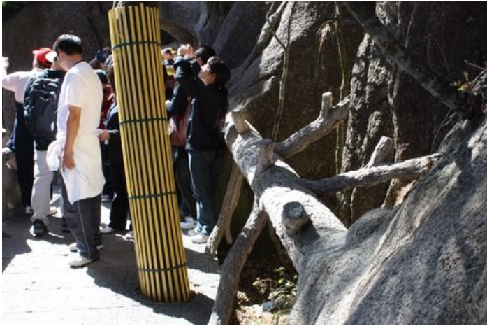
Pie z lewej ó aby ludzie nie zniszczyli drzewa! Tu obok z prawej strony ó zamaskowana rura ☺