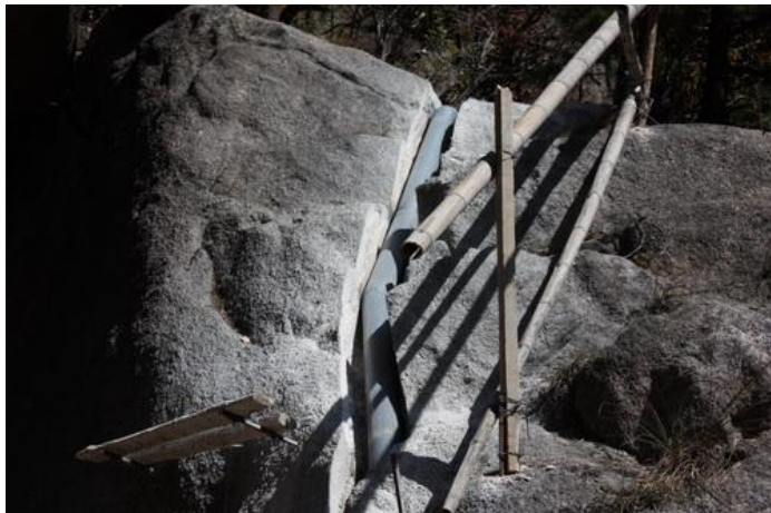
Wtapianie rury w otoczenie | z prawej: ekopor czy