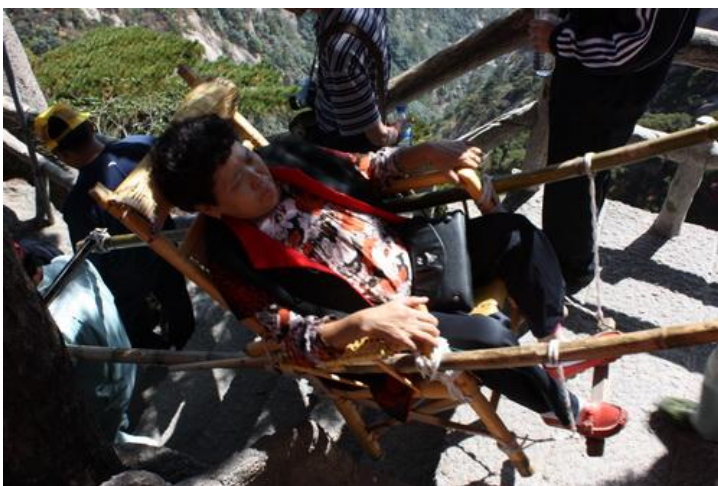
Kolejk lub lektyk , ostatecznie na nogach ó jak kto woli

Moim zdaniem tak powinno by w ka dym nazbyt popularnym rezerwacie!