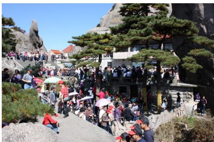
Żymy turystów w Źółych Górach ó niemniej spoko - wszystko jest pod kontrolą !

Huang Shan ó od 1990 roku wpisane na list UNESCO ó od wieków swym tajemniczym pińkmem był natchnieniem dla cesarzy, poetów, malarzy jak i również zwykłych ludzi.