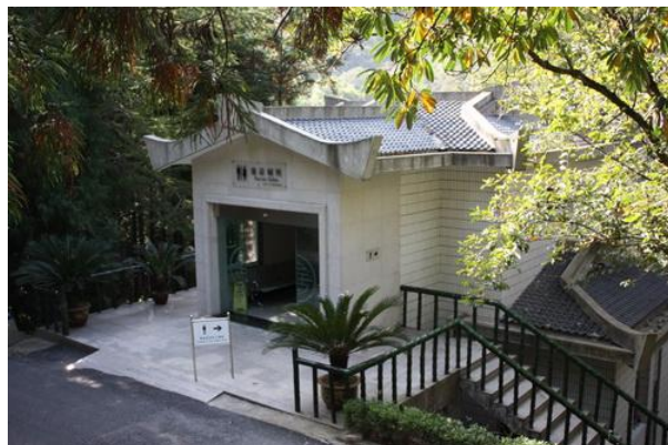
Elegancka toaleta w Źółych Górach

O arówkach: http://frycz.pl.salon24.pl/144326,swietlowka-kompaktowa-czyli-my-ekofrajerzy